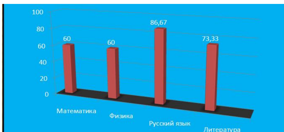
Рис. 4 Процент качества знаний по учебным предметам (10 класс)