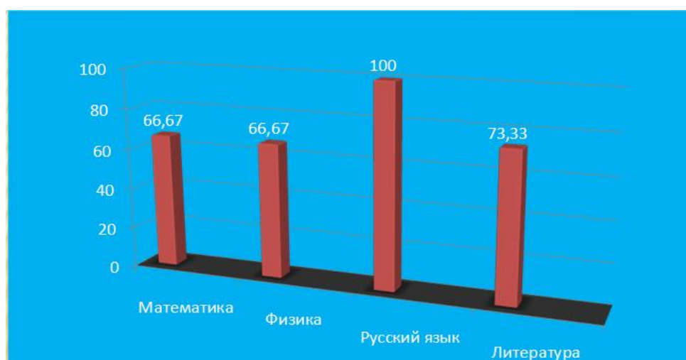
Рис. 5 Процент качества знаний по учебным предметам (11 класс)

Из 21 аттестованных обучающихся 6 обучаются на «хорошо» и «отлично», что составляет 28,6 %