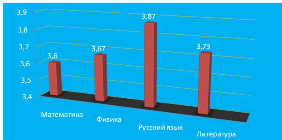
Рис. 2 Средний балл по учебным предметам (10 класс)

Средний балл в 10 и в 11 классе составил 3,9 баллов. В 10 классе (в частности по физике – 3,67 б., по русскому языку – 3,87, по математике – 3,6 б., по литературе – 3,73 б.). В 11 классе (в частности по физике – 3,67 б., по русскому языку – 4, по математике – 3,67 б., по литературе – 3,83 б.) (рис.2, рис.3)