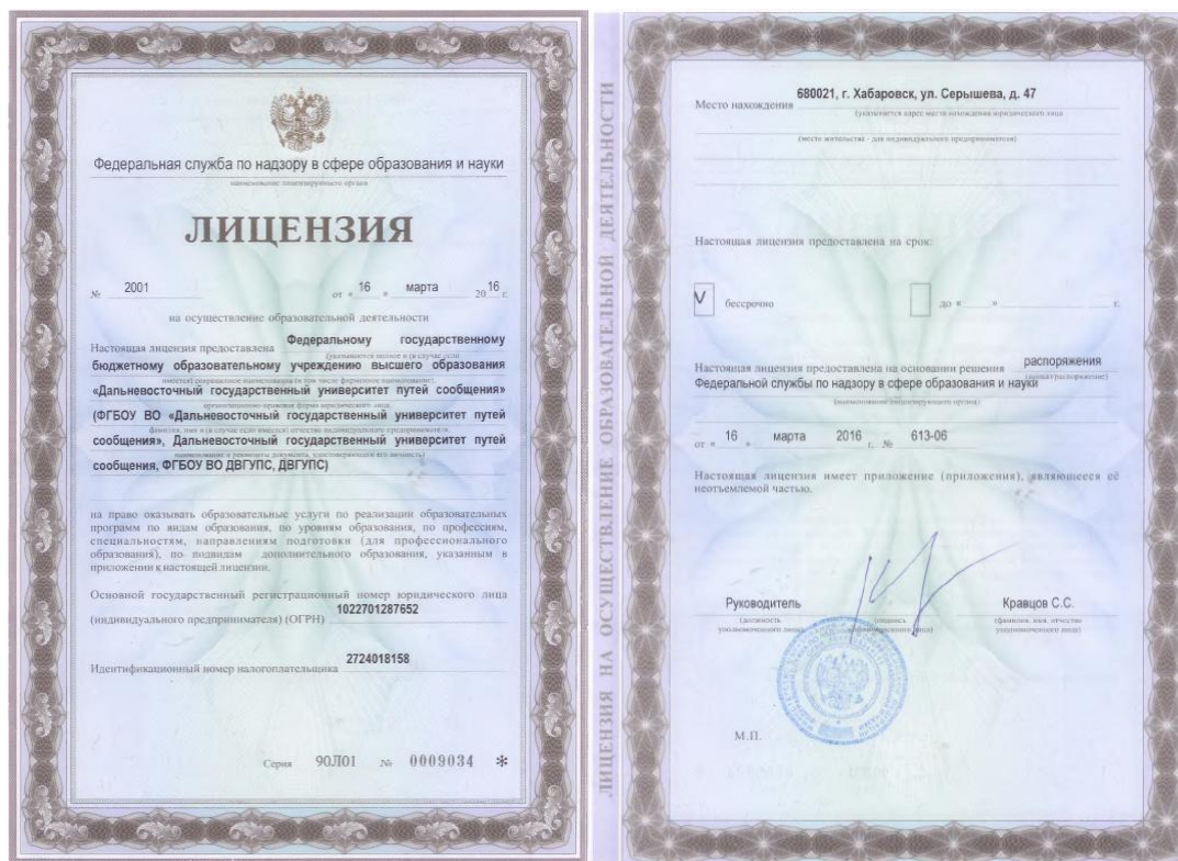
Рис. 1 Лицензия на право ведения образовательной деятельности

Лицей БАМИЖТ – филиала ДВГУПС в г. Тынде осуществляет образовательную деятельность на основании лицензии, выданной Федеральной службой по надзору в сфере образования и науки от 16 марта 2016 г. бессрочно, серия 90Л01№ 0009034 регистрационный номер 2001 (рис. 1).